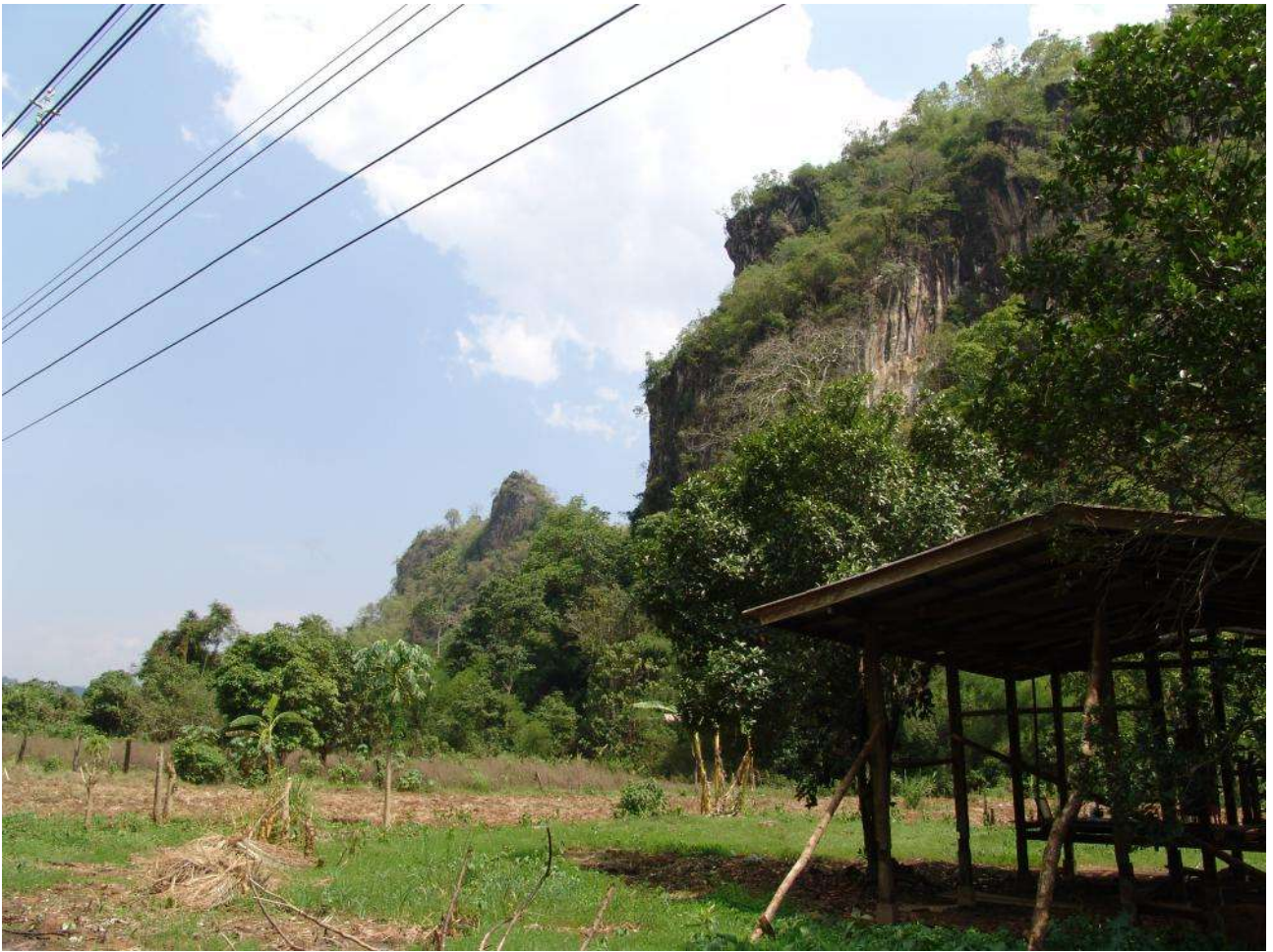
so das waer's fuer heute Helmut